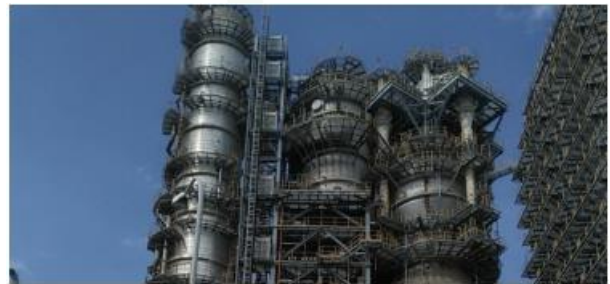
Các nhà máy lọc dầu tại Việt Nam thải ra mỗi ngày vài tấn xúc tác đã qua sử dụng.

Đối với Tập đoàn Dầu khí Việt Nam, nhà điều hành nhà máy lọc dầu tại Dung Quất, việc đáp ứng nhu cầu ngày càng tăng đối với propen là một thách thức. Ngoài ra, với việc phát sinh tới 18 tấn chất xúc tác FCC mỗi ngày, tập đoàn này đang phải đối mặt với vấn đề chôn lấp và tái chế.